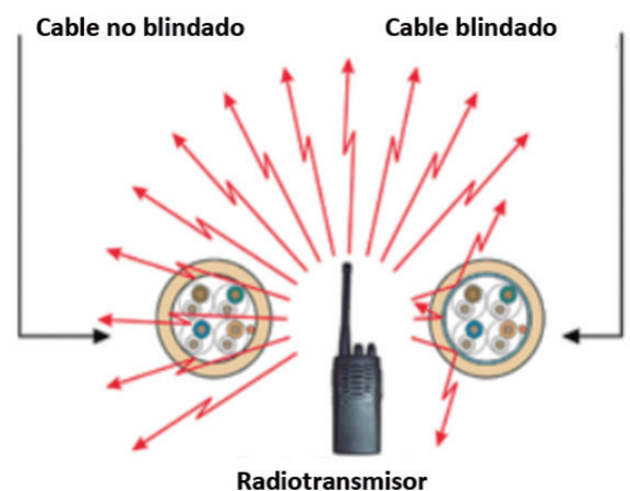
Figura 6. Efecto de las líneas de campo eléctrico sobre un cable blindado y un cable no blindado.

Los cables son muy a menudo parte del problema de EMI. Si se tiene un cable blindado, la conexión de la pantalla del cable en el conector es sospechosa. La terminación de la pantalla del cable en el conector y el acoplamiento del conector al chasis de la envolvente metálica debe estar bien hecho o el cable tendrá pérdidas de radiación. La conexión de la pantalla (terminación) debe ser realizada a 360° en cada lado del cable. Las terminaciones tipo coleta ("pigtail") y en un único lado de conexión a masa no son aceptables. Se puede arreglar temporalmente usando cinta de cobre para cerrar las posibles brechas en la zona del conector. Si esto no es posible, se debe utilizar papel de aluminio para hacer un blindaje temporal sobre la pantalla, conectando la pantalla a la caja en cada extremo. No debemos olvidar asegurar que las superficies de contacto son totalmente conductoras, rascando la pintura si es necesario. Si el cable se filtra pero no es blindado, asegurarse de que el conjunto del filtro está bien conectado a la carcasa del conector